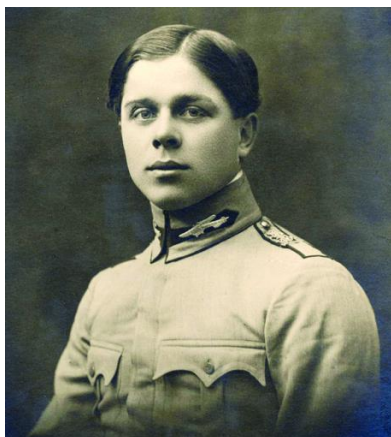
Imaginea 15 - Căpitanul aviator Vasile Craiu

Vasile Craiu a fost considerat, în timpul Primului Război Mondial, cel mai bun pilot militar român. El a executat primele misiuni de noapte din istoria aviației române și a realizat prima doborâre a unui avion militar german pe frontul românesc, în 1917. A devenit căpitan la 23 de ani, fiindu-i astfel recunoscute meritele militare. Și-a pierdut viața în 1918, la Bârlad, în urma unui accident de aviație, la vârsta de 24 de ani.