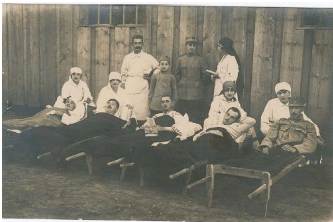
Imaginea 18 - Scenă dintr-un spital de campanie, pe frontul din Moldova, 1917. Imaginea prezintă soldați grav răniți în timpul luptelor, asistați de personalul medical și un copil de trupă