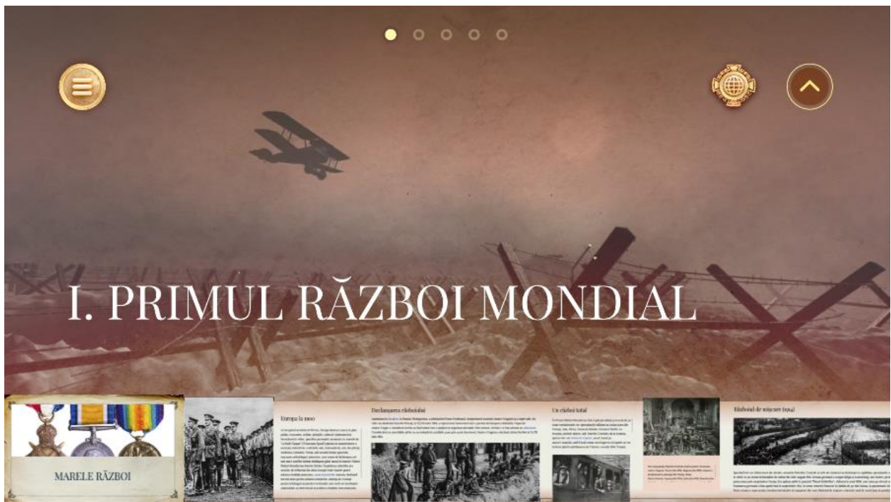
Imaginea 2 - Capitoare bogate în informații, ilustrate cu vaste galerii de imagini