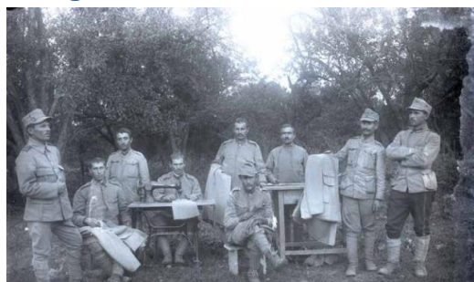
Imaginea 20 - "Croitorii" regimentului (1917), colecția Muzeului Național de Istorie a României

În Primul Război Mondial, ca și în evenimentele legate de întregirea României la 1918, s-au implicat și fotografi, scriitori, memorialiști, artiști plastici, fiecare dintre aceștia transferând, în operele lor, emoții, gânduri și experiențe personale prilejuite. Unii dintre ei au luptat pe front, alții au activat pe "frontul de acasă", contribuind, fiecare în parte, la împlinirea proiectului unității naționale