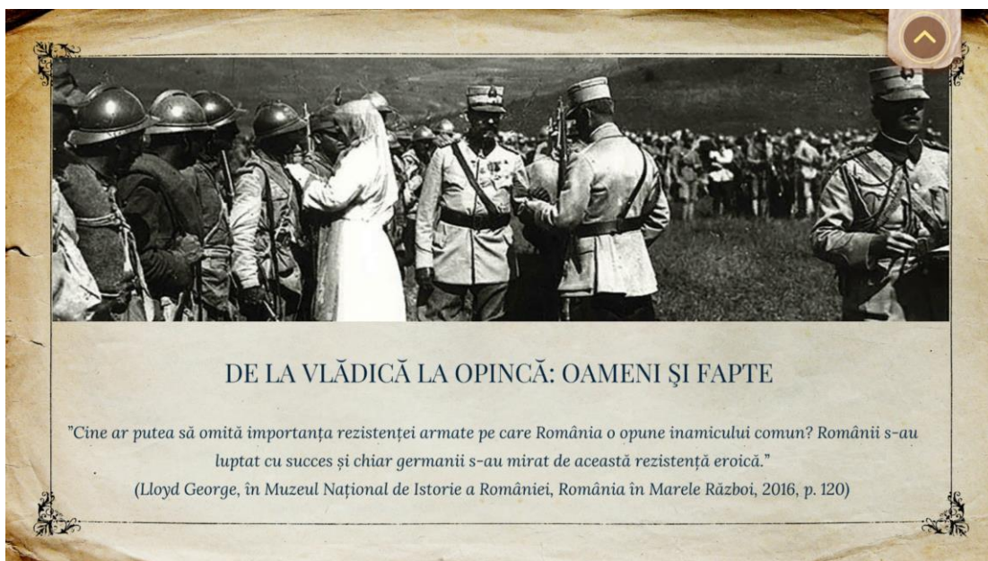
Imaginea 7 - despre oameni cărora le datorăm existența noastră de astăzi