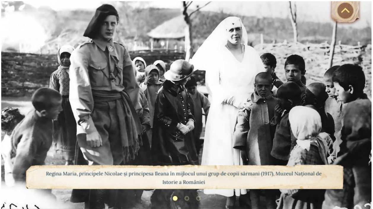
Regina Maria, principele Nicolae și principesa Ileana în mijlocul unui grup de copii sărmani (1917), Muzeul Național de Istorie a României

Imaginea 8 - Imagini de colecție, prelucrate grafic la înaltă calitate