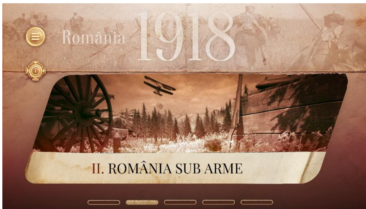
Imaginea 4 - Fiecare capitol este ilustrat cu o fotografie de epocă animată (avionul din imagine survolează)