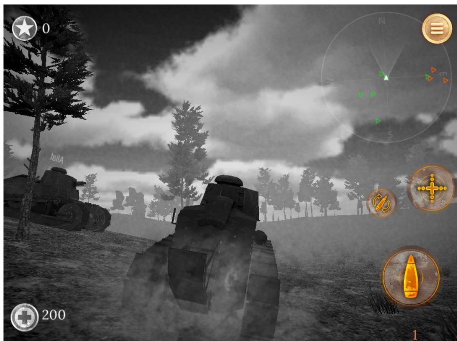
Imaginea 9 - Simulator al primei lupte cu tancuri

În aplicație există două jocuri: unul cu tancuri, care simulează bătălia de la Villers-Bretonneux, și unul cu avioane de luptă, care reproduce bătălia de pe Somme.