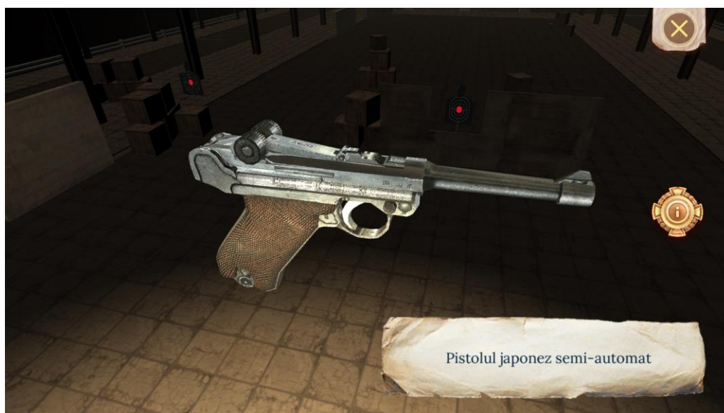
Imaginea 3 - modele 3D ale armelor folosite în Marele Război