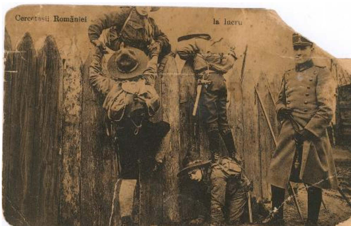
Imaginea 19 - Exercițiu al membrilor „Cercetașilor României” sub supravegherea unui ofițer. Fondată oficial cu doi înainte de intrarea României în război, a fost inițial gândită ca o asociație de educație și sport pentru copii și adolescenți