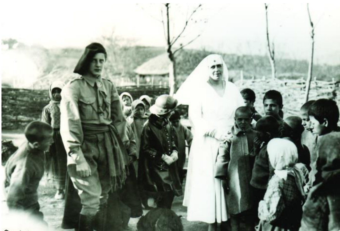
Imaginea 13 - Regina Maria, principele Nicolae și principesa Ileana în mijlocul unui grup de copii orfani (1917)

”Cer de la toți cea mai deplină ascultare și cea mai strictă executare a ordinelor primite...”