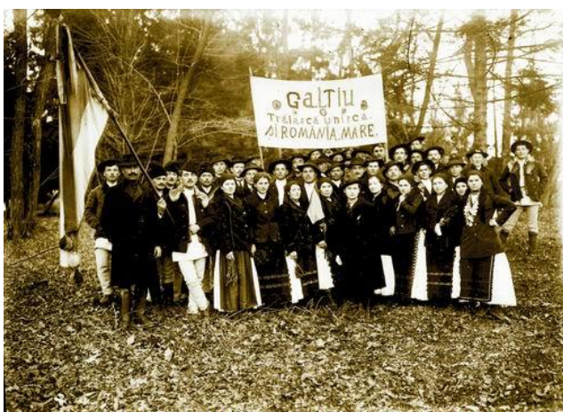
Imaginea 24 - Sătenii din Galtiu, satul natal al lui Samoilă Mârza, se pregătesc să participe la Marea Adunare Națională de la Alba Iulia (1918); fotografie de Samoilă Mârza, colecția Muzeului Național al Unirii Alba Iulia

Într-un certificat eliberat de Eugen Hulea și Ion Berciu în 1945, se spunea: Este singurul fotograf care a fost prezent la Adunarea Națională din Alba Iulia, din 1 Decembrie 1918, și susnumitul a immortalizat în 5 (cinci) fotografii unice imaginile istorice dela Marea Adunare Națională care a hotărât unirea Ardealului cu România. (...) ca un sincer patriot român, a pus la dispoziția Țării sale aceste documente de o mare valoare istorică, în mod gratuit, fără a avea nici un fel de beneficiu de pe urma muncii și inspirației sale. (Muzeul Național al Unirii Alba Iulia)