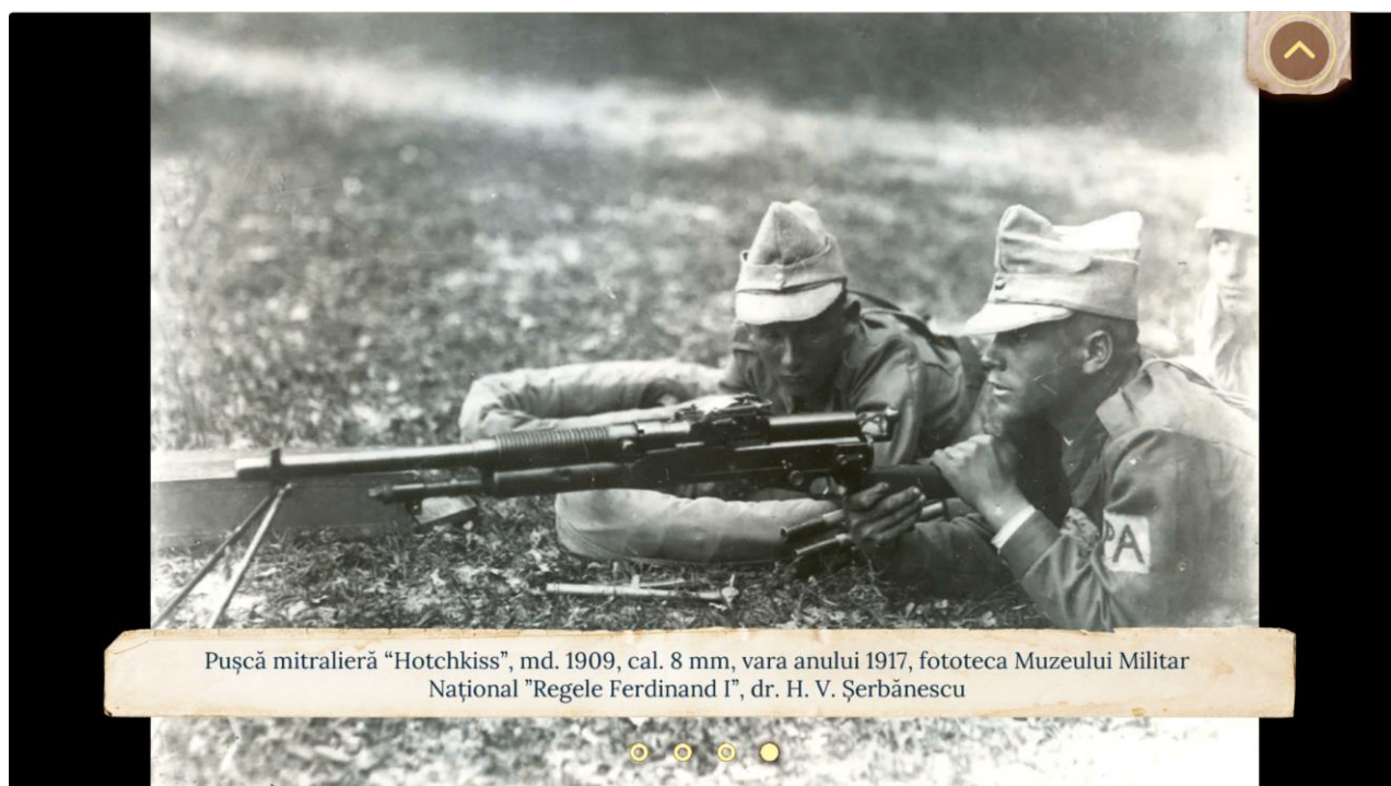
Imaginea 6 - Pe linia frontului

Echipamente militare utilizate pe front. Mărturiile soldaților și ale comandanților lor