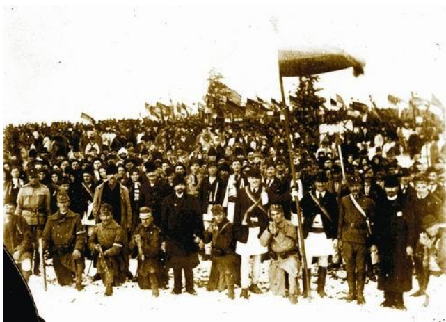
Imaginea 23 - Civili și militari la Marea Adunare Națională de la Alba Iulia (1 Decembrie 1918); fotografie de Samoilă Mârza, colecția Muzeului Național al Unirii Alba Iulia

La 1 decembrie 1918, cu aparatul său de fotografiat, Samoilă Mârza a obținut singurele imagini păstrate până azi de la Marea Adunare Națională de la Alba Iulia. Fotografatul s-a aflat în rândul mulțimii, fapt ce i-a permis să redea în imagini atmosfera de sărbătoare a evenimentului, însuflețirea cu care românii au participat la adunare și numărul copleșitor al celor prezenți. Potrivit unor relatări ulterioare, aparatul fusese cumpărat de tatăl fotografului, contra unei perechi de boi! Cu acest aparat, Samoilă Mârza a mai fotografiat și alte evenimente, printre care s-au numărat activitățile prilejuite de centenarul nașterii lui Avram Iancu, sărbătorit în 1924. Spre sfârșitul vieții, din cauza sărăciei în care trăia, Samoilă Mârza a vândut multe dintre clișeele pe care le deținea precum și aparatul de fotografiat. Acesta a ajuns în patrimoniul Muzeului Național al Unirii Alba Iulia.