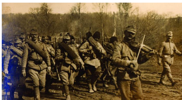
Imaginea 11 - Soldați români îndreptându-se către front în campania din 1916, în "L'Album de la Guerre", vol. II, 1923, pag. 125

De la vlădică la opincă - bărbați, femei și copii pe front și în spatele frontului În vara anului 1916, România, condusă de regele Ferdinand I, a intrat în Marele Război ca stat membru al Antantei, cu scopul eliberării teritoriilor locuite de români aflate sub stăpânirea Imperiului Austro-Ungar. În tranșee, în primele linii de luptă, ca și în spatele frontului, nenumărați bărbați, femei și copii au contribuit purtarea războiului ca și la evenimentele ce aveau să ducă la Marea Unire din 1918.