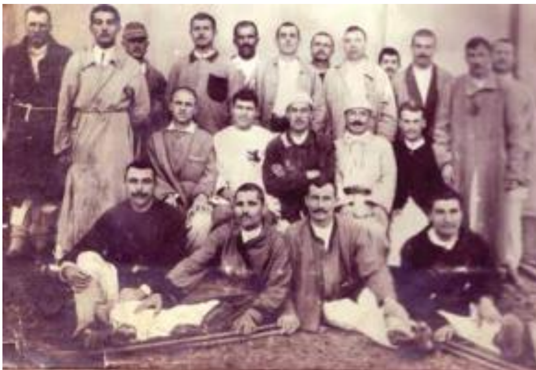
Imaginea 22 - Un grup de răniți la spitalul din Roman; fotografiede Constantin (Costică) Acsinte, 1918, colecția Muzeului Județean Ialomița

numeroase filme fotografice, recondiționate și puse în valoare în ultimii ani sub egida Muzeului Județean Ialomița.