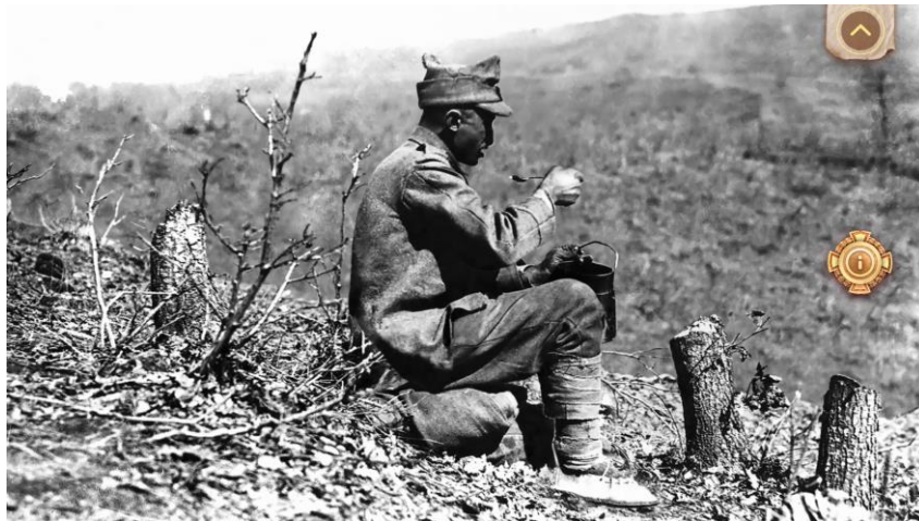
Imaginea 1 - Ultima masă