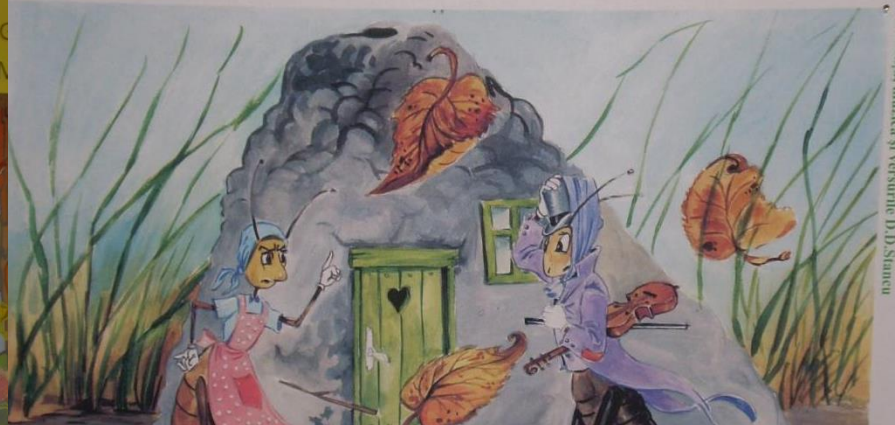
Furcile, muzica și versurile D.D. Stănescu