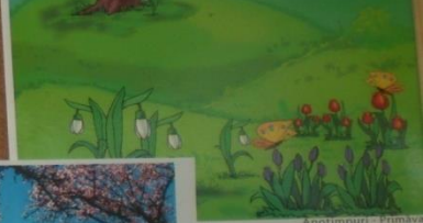
Anotimpuri - Primăvară