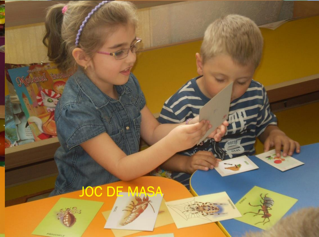
JOC DE MASA